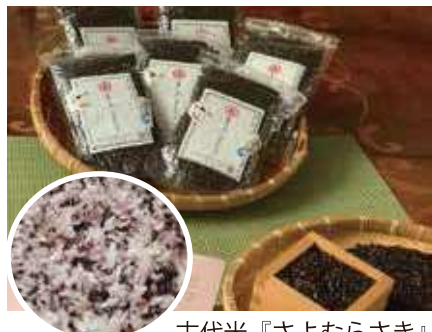
古代米『さよむらさき』

廣原 ビオトープにカルガモが飛来して巣を作ったり、稲刈りの時にカヤネズミの子どもが巣から逃げ出すところに遭遇したり、新種ではなからうかという昆虫を発見したり……。里山は自然の宝庫なので、毎回驚きと感動が味わえると喜んで頂いています。無農薬にこだわっているのも、動植物にとっても居心地のいい場所なんです。